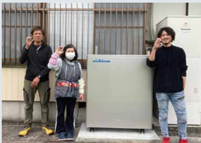
職人さんとの記念撮影▲